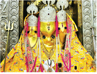
हरिभूमि न्यूज | नलखेड़ा

सिद्धपीठ मां बगलामुखी मंदिर पर गुप्त नवरात्रि के अष्टम दिवस रविवार को मां के आंगन में आस्था का सैलाब देखने को मिला। श्रद्धालुओं ने घंटों लाइन में लगकर मां के दर्शन किए। इस दौरान मां के जयकारे से पूरा मंदिर परिसर गुंजायमान हो रहा था। रविवार अवकाश का दिन होने एवं नवरात्रि की अष्टमी होने से सुबह से ही भक्तों की भीड़ माता मंदिर पर लगी रही जो देर रात तक जारी थी। इस दौरान लगभग 50 हजार से अधिक भक्तों ने मां के दरबार में अपनी हाजरी लगाई। हवन कुंड पर भी भक्तों को हवन अनुष्ठान करने के लिए इंतजार करना पड़ा। सुबह से ही शाम 7 बजे तक के लिए सभी हवन कुंड की बुकिंग हो चुकी थी।